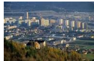
Innsbruck, Olympisches Dorf

Kleinere Gemeinden sind vor allem in den Peripherregionen und in den Talschlüssen anzutreffen. Gehäuft ist das im Außerfern, in Osttirol, im Münstertal und im Unterengadin, am Sulz- und Nonsberg sowie im Cembratal und in der Carnia der Fall.